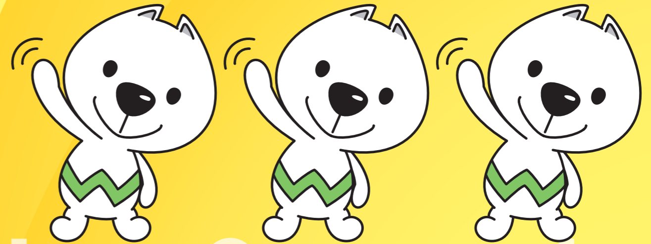
和歌山県PRキャラクター きいちゃん